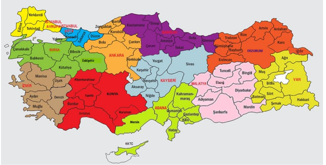
Şekil 1. Yarışma Bölgeleri Haritası

Bu yarışma, Türkiye genelinde 12 bölgede yapılmaktadır. Her bölge için bir il, merkez olarak seçilmiştir. Her bölgenin il merkezinden iki öğretim üyesi, TÜBİTAK tarafından yarışmalardan sorumlu Bölge Koordinatörü ve Bölge Koordinatör Yardımcısı olarak görevlendirilir. Adana, Ankara, Bursa, Erzurum, Konya, İstanbul Asya, İstanbul Avrupa, İzmir, Kayseri, Malatya, Samsun ve Van bölge merkezi illerdir. İllerin bölgelere göre dağılımları Şekil 1'de verilmiştir.